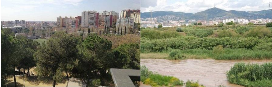
Els blocs de Can Serra , vistos des de la Florida amb el parc de les Planes en primer terme. I els blocs de Can Serra des de la llera del riu Llobregat

Després d'aquests primers mesos de pandèmia, observem quina repercussió ha tingut en el nostre entorn, en els carrers, places i parcs, en el medi natural que tenim a tocar.