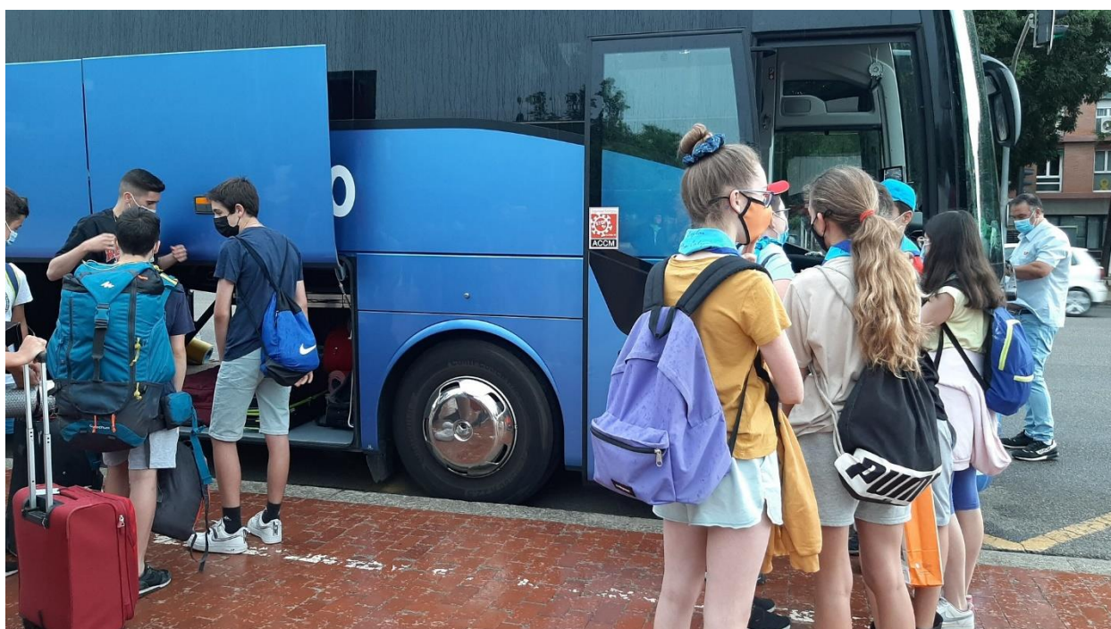
Joves marxant de colònies aquest mes de juny

Arran de la crisi econòmica del 2008 el temps de lleure educatiu per a molts infants i joves va passar a ser d'exclusió. Les prioritats de nombroses famílies van canviar, amoïnades per la subsistència, i molts infants van haver de deixar d'anar a casals d'estiu i colònies, ja que els seus pares no s'ho podien permetre. I ara, amb la pandèmia, la situació s'ha agreujat. Ho constata la Fundació Pere Tarrés en un informe que va fer públic a principis d'any, del que se'n desprèn que les condicions d'accés al lleure han empitjorat. L'estudi de les condicions de vida dels beneficiaris de les beques d'estiu de