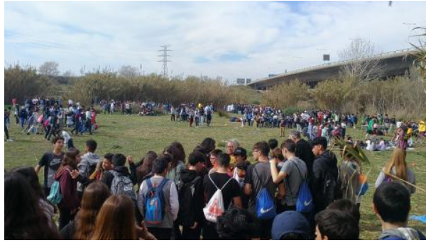
Estudiants de les escoles de la ciutat fent una activitat a l'Esplanada dels Padrins