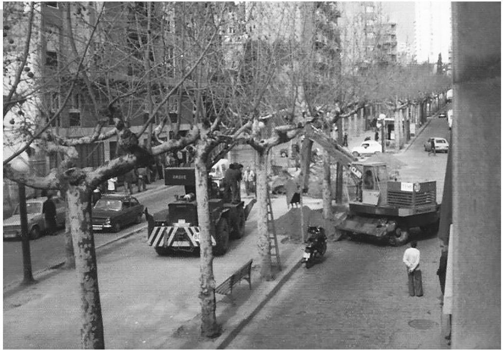
Il·lustració 2. Una imatge de la Rambla Just Oliveras de l'Hospitalet en obres el 1977.

de 1.281 barraques, habitades per 5.504 persones 65 .