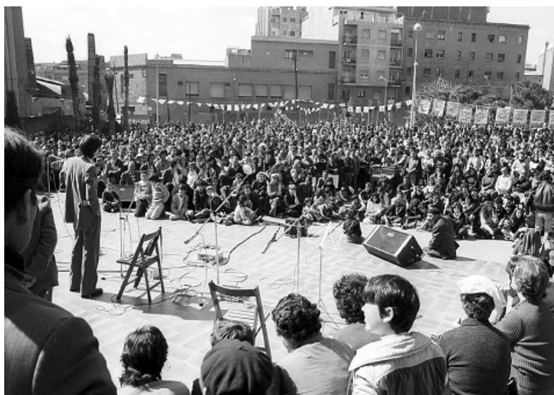
Figura 14. Acte del PSUC, al parc de la Marquesa, durant la campanya de les eleccions municipals del 3 d'abril de 1979.

Les primeres mesures del nou consistori (figura 15) van ser: el ja aleshores mític "Ni un bloc més" (discussió un per un dels projectes aollits a la transitòria 7 del PGM –explicada més amunt– i avaluació restrictiva de qualsevol altre projecte per fer nous habitatges), resoldre el conflicte de la taxa de recollida d'escombraries, elaborar un pla urgent per posar papereres i arbres als carrers, aconseguir solars i fer-hi més escoles, lluitar contra la contaminació (La Farga, Cardoner i casos més localitzats), iniciar la redacció d'un Pla de Protecció del Patrimoni Arquitectònic, defensar el nou Pla Parcial de Bellvitge, vetllar pels interessos de la ciutat en la programació d'infraestructures i equipaments per als Jocs Olímpics que es preveien per a l'any 1992, canviar el nom dels carrers que homenatjaven franquistes i, per últim, prestar suport als treballadors de les empreses en situacions conflictives i lluita contra l'atur.