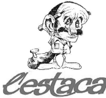
Figura 12. L'Estaca, una fita en la comunicació local a l'Hospitalet.