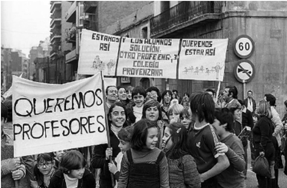
Figura 2. Manifestació per la carretera de Santa Eulàlia d'alumnes, pares i mares i professorat de l'escola Provençana.

a) Un territori "trinxat" per vies de tren, línies d'alta tensió i vies urbanes gairebé sempre col·lapsades pels cotxes. El soterrament del Carrilet i la construcció de les Rondes van anar reduint després el desastre, però el tema Rodalies continua igual 40 anys després. L'ampliació del metro també ha estat positiva. L'abril del 1979 sols teníem dues estacions: Santa Eulàlia i Pubilla Casas –i una altra a tocar: Sant Ramon, ara Collblanc. Cal esmentar que, des d'aleshores, mentre la Generalitat ha ampliat i modernitzat significativament l'anomenat Carrilet, RENFE està pràcticament igual que aleshores malgrat les promeses de cada quatre anys, quan venen eleccions.