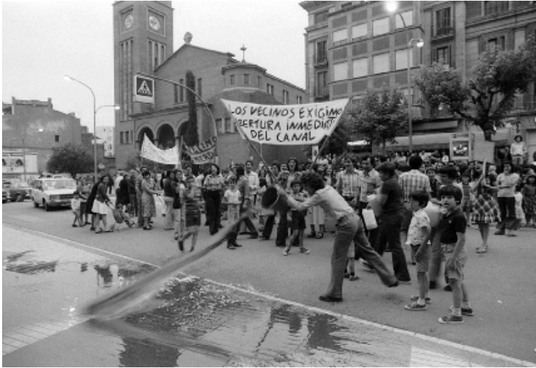
Figura 13. Veïns de la zona del Canal de la Infanta, a Sant Josep, aboquen davant l'Ajuntament aigües fecals sobreixides del tram del rec a cel obert en la darrera inundació.

Una de les seves iniciatives va ser convocar el 1978 els partits que tenien opcions per entrar al futur consistori democràtic, per posar-los al dia sobre els problemes de la ciutat. Però, com que no podia oferir res respecte als de "primera divisió" (La Farga, taxa d'escombraries, transitòria 7 del Pla Comarcal...), en va posar sobre la taula uns quants d'importants, però de "segona divisió", com ara que el cementiri era a fregar el col·lapse... Els representants del PSUC li vam dir que primer calia parlar dels problemes de primera i els altres partits ens van donar la raó. Aquí va acabar la reunió i no se'n va fer cap altra.