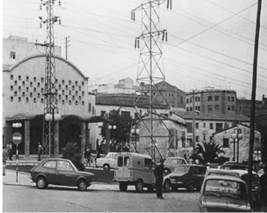
Figura 6. Façana principal i cases del voltant de la parròquia Mare de Déu de la Llum, de la Florida, acompanyades d'una de les aleshores omnipresents torres d'alta tensió. Font: AMHLAF0004248. Autor desconegut (1970)

f) Sanfeliu. Els primers traçats de la futura ronda de Dalt trinxaven bona part dels habitatges unifamiliars del Canyet.