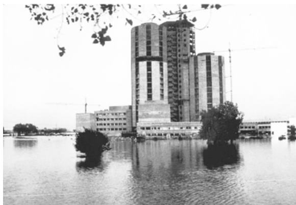
Figura 5. L'Hospital de Bellvitge en obres, el 1971, envoltat de camps inundats. Font: AMHL 901 AF 0003323. Rafael Zuriguel (1971)

b) Can Serra. La part central del barri, en aquell moment mig construït, també estava amenaçada pel Pla Parcial. L'Ajuntament d'Espanya Muntadas va posar al solar un teatre desmuntable i provisional, una carpa que va donar nom a la zona, a l'espera que la immobiliària decidís construir-hi. El vent se la va endur l'any 1972. Un altre problema era la contaminació produïda per les bòbiles d'on ara hi ha el Parc de les Planes.