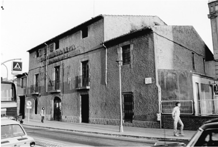
Figura 7. Ca l'Adela Oliveras, amb simbologia franquista a la façana, poc abans del seu enderroc. Font: AMHLAF0000403. Monrós (1974)