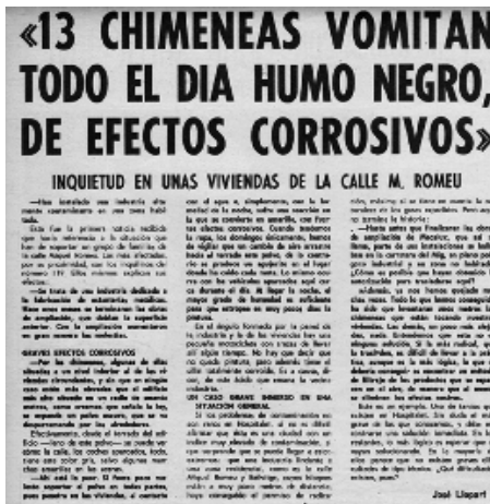
Figura 8. Així explicava la premsa d'aleshores com era la vida dels veïns al costat d'indústries contaminants, en aquest cas del barri de Sant Josep. Font: Suplement del Diari de Barcelona 08.06.1973