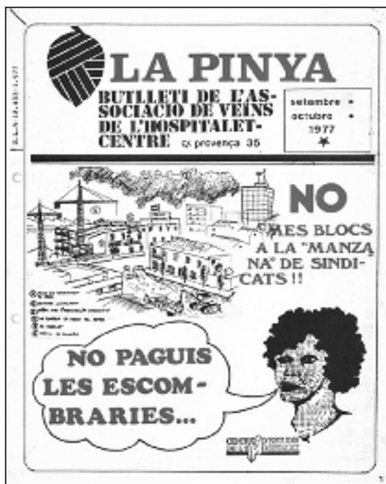
Figura 16. Portada de la revista de l'Associació de Veïns del Centre demanant el boicot al pagament de la taxa d'escombraries (07.77).

es va aconseguir la promesa verbal de traslladar les instal·lacions a uns terrenys que l'empresa deia que tenia a Castellbisbal, sense comprometre-hi, però, cap data. Després de les eleccions del 79 la situació continuava igual.