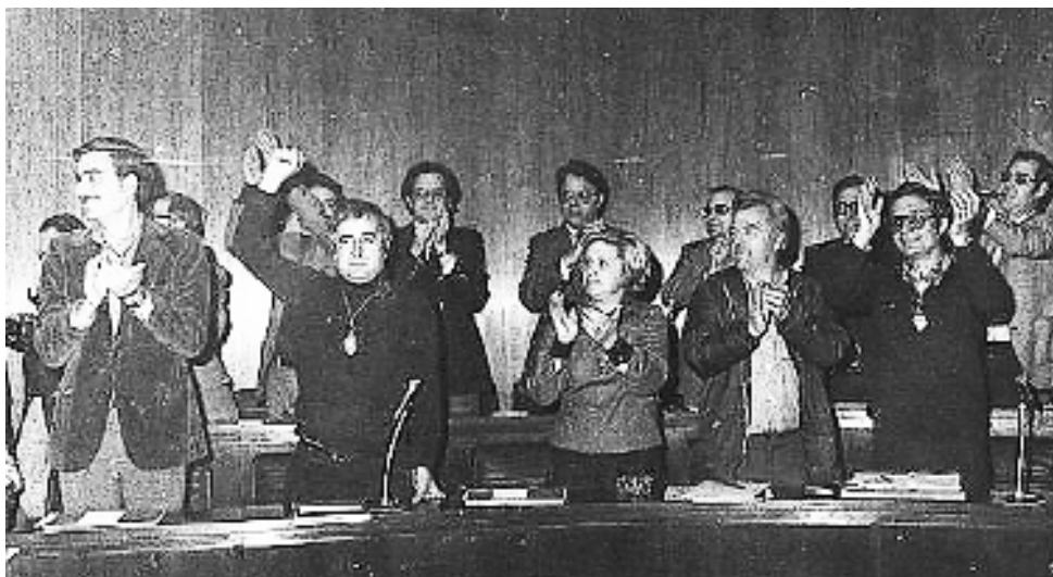
Figura 25. Regidors del PSUC, en primer terme, el dia de la constitució del primer Ajuntament democràtic. Font: AMHLAF0023532, autor desconegut (1979)

Una excepció curiosa: va costar força convèncer el Gremi de Forners que era totalment il·legal que l'Ajuntament impedís entrar al terme municipal pa elaborat en altres localitats, encara que fossin properes, com ells pretenien.