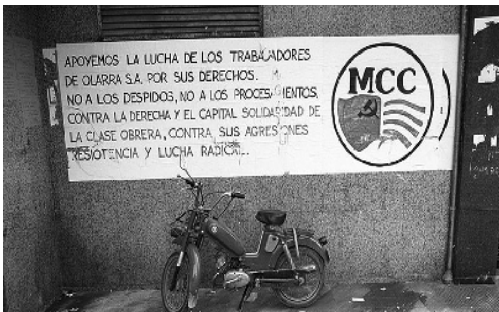
Figura 19. Rètol reivindicatiu a l'entrada d'un edifici en suport als treballadors d'Olarra S.A., signat pel MCC (Moviment Comunista de Catalunya).

va mantenir les protestes. Les plantes municipals es van fer en un mandat posterior al nostre i ara acullen el Centre Cultural del barri.