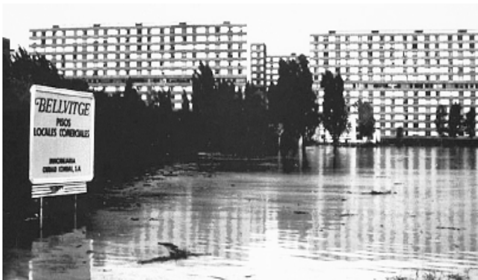
Figura 20. Solar de Bellvitge inundat, després d'una riuada i al fons els primers blocs de pisos del barri.

mal. Els dies que amenaçava ploure amb força, els veïns dormien amb un peu fora del llit i tocant amb ell a terra, per tenir temps de fugir amb els seus, si calia. Sovint calia, i l'aigua arribava fins a mig metre d'alçada o més, fent malbé tot el que quedava per sota del seu nivell. El nou Ajuntament va pagar part del cost de pisos "normals" per allotjar-hi els afectats i l'empresa (Inmobiliaria Ciudad Condal) els va recol·locar en uns de nous.