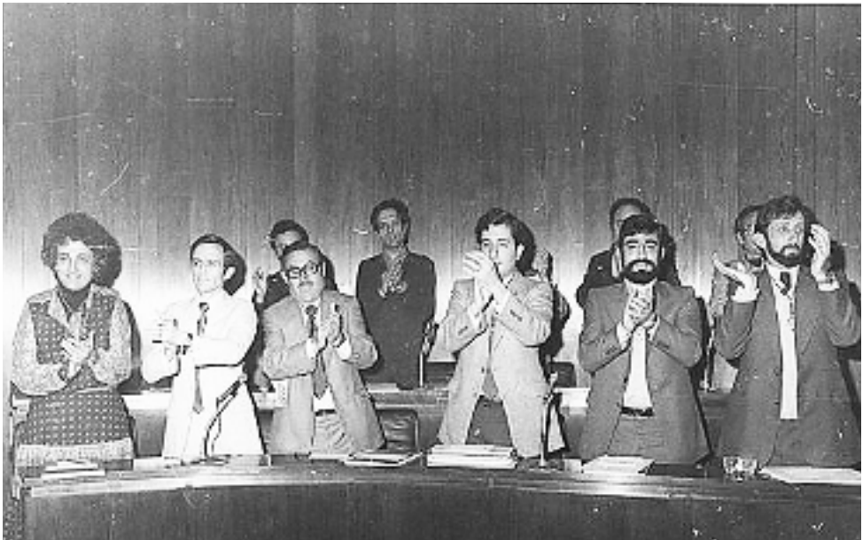
Figura 24. Regidors del PSC, en primer terme, el dia de la constitució del primer Ajuntament democràtic.

La Unió de Botiguers. Mai hi va haver cap problema important, inclús les relacions van arribar a ser cordials després del conflicte de l'Hiper Bellvitge (que s'explica més endavant).