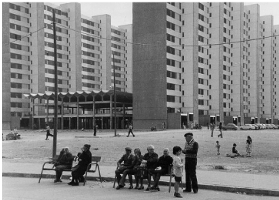
Figura 1. Veïns prenent el sol i nens jugant al barri de Bellvitge el 1975.

En l'etapa final de la dictadura vaig entrar a militar en el PSUC, partit que em va posar de número 6 a la candidatura per a les eleccions municipals de 1979 i vaig sortir elegit. En la següent convocatòria (1983) jo anava de número 7. Van ser elegits solament tres regidors, i vaig tornar a les meves vocacions: l'ensenyament i el periodisme.