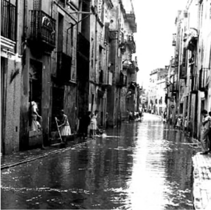
Figura 4. Carrer Major de l'Hospitalet inundat per pluges torrencials, segurament les de setembre de 1971.

tatges del que es construïa dia rere dia. El cas més flagrant era Bellvitge, edificat sense tenir en compte que era un terreny històricament inundable, però es repetia a gairebé tota la ciutat. Aquí també l'Ajuntament de Capdevila va iniciar uns quants grans projectes, però encara eren insuficients. I cal repetir una obvietat: la urbanització dels terrenys agrícoles, no solament crea evidents problemes alimentaris i de medi ambient, també impedeix que l'aigua de la pluja baixi al subsol, a la irrepetible capa freàtica del Baix Llobregat. Aleshores corre amb més força per sobre de la superfície asfaltada. L'Hospitalet es troba, a més, a cavall del Samontà, que cau gairebé a plom sobre la Marina-Pla del Llobregat. Les inundacions són inevitables a menys que hi hagi prou superfície de filtració i/o es destinin molts recursos a canalitzacions potents (figures 4 i 5).