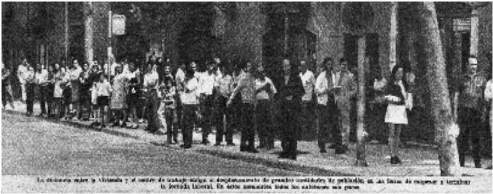
Figura 18. Cues davant d'una parada d'autobús a l'Hospitalet.

de parer. Aleshores, d'acord amb el Govern, es va convocar un referèndum sobre el futur traçat Barcelona-Sant Josep, ja que el tram de Santa Eulàlia es duplicava amb el metro. Entre tres opcions, els veïns van triar fer-lo per on ara passa (línia 8).