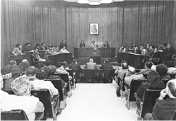
Figura 15. Acte de presa de possessió del nou consistori, l'abril de 1979.

Taxa d'escombraries. El conflicte estava enquistat des de feia temps, sense que les converses amb l'empresa FOCSA arribessin mai a aclarir com es calculava l'import de la taxa. Des del 1977, als veïns se'ls havia cobrat solament el preu antic i la diferència fins al nou havia quedat en suspens. L'any 1982, el PSC va portar al Ple donar per bons els inconcrets càlculs de FOCSA, en base a un informe ambigu dels tècnics municipals (sols concloïa que "la tasa es conceptualmente correcta", sense concretar què volia dir "conceptualmente"). El PSC va bloquejar qualsevol debat al respecte i va precipitar la votació. Només el PSUC va fer-ho en contra i, per tant, es va decidir que es reclamaria als veïns la diferència de preu fins a l'import nou de la taxa acumulada durant tots aquells anys. Va ser un dels grans motius de fricció entre PSC i PSUC durant el mandat. Cal remarcar que el mobilitzador eslògan de "no pagar las basuras" (figura 16) va ser contraproductiu a la llarga, per ambigu, quan després va caldre fer entendre al veïnat que pagar impostos i taxes municipals és imprescindible, i cívicament responsable.