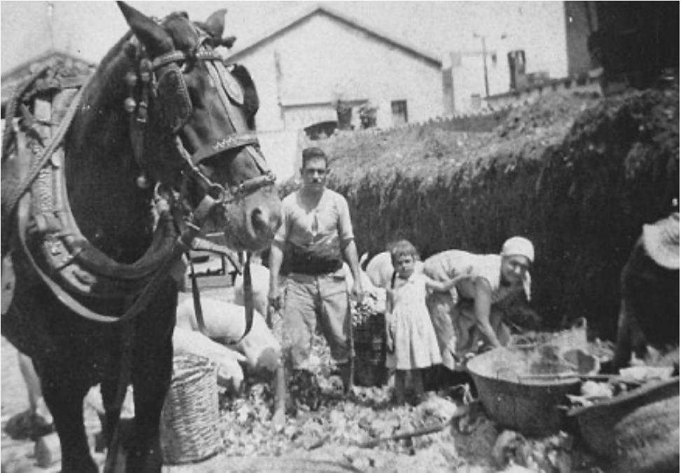
Figura 21. Família d'escombriaires amb cabassos, al carrer de la Igualtat, 46, de Santa Eulàlia, i al seu darrere uns porcs menjant deixalles.

ultra Matías de España Muntadas. Es va aprofitar també per catalanitzar les plaques, i ens vam trobar en un atzucac curiós: teníem un carrer Roselles i un carrer Amapolas. El nostre canvi de noms, però, va quedar curt. Ens vam deixar alguns noms poc presentables. Per exemple, el de Baldomero Espartero, que va bombardejar Barcelona (1842 i 1843) amb l'artilleria de Montjuïc, per a reprimir sengles bullangues de les que sovint esclataven a la ciutat. Aquest general tenia carrers per a molts del seus títols. A Barcelona, Duque de la Victoria, i a l'Hospitalet, Príncipe de Vergara. Barcelona va deixar el seu, simplement, com carrer del Duc; però a l'Hospitalet no s'ha fet res, ni nosaltres ni els que han vingut darrere. Per justícia històrica, jo el batejaria "1 d'octubre de 2017" (encara que ja hi hagi in pectore un parc amb aquest nom) o fer com a Barcelona: carrer del Príncep.